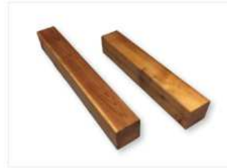
POTEAU DE BOIS POUR PATIO Prix Balcon Depot