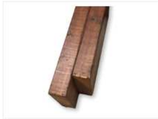
POUTRELLE DE BOIS Prix Balcon Depot