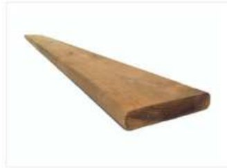
REVÊTEMENT PLANCHE BOIS TRAITÉ Prix Balcon Depot