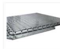
STRUCTURA – POUR BALCON DE PAVÉ