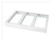
STRUCTURE EN ALUMINIUM