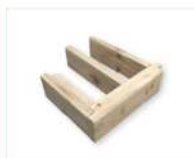
STRUCTURE BOIS NATUREL