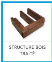
STRUCTURE BOIS TRAITÉ