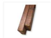
POUTRELLE DE BOIS